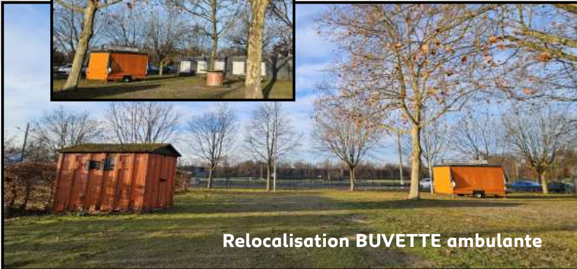
Relocalisation BUVETTE ambulante