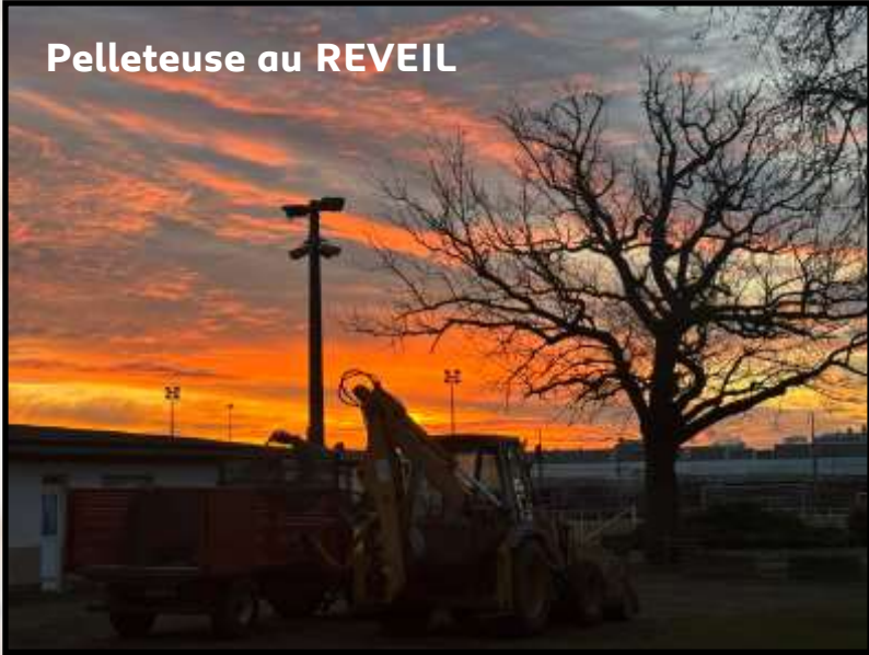
Pelleteuse au REVEIL