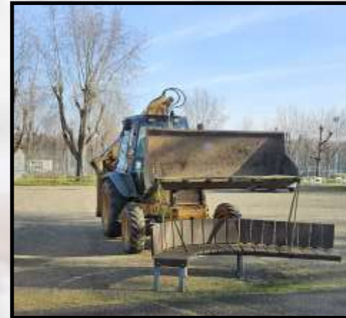
Pour les tournantes pendant les PAUSES...